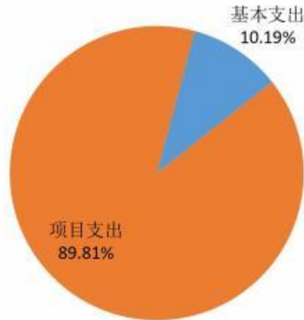
图2：支出决算构成情况